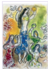
Marc Chagall, The dance of Myriam, 1966.

Miriam tanzte vor Freude, David tanzte, als die Bundeslade nach Jerusalem gebracht wurde – Tanz als Ausdruck der Dankbarkeit, die vor Gott gebracht wird, ist so alt wie die Bibel!